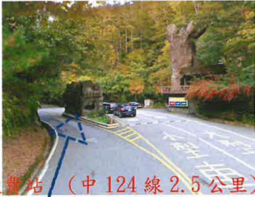
武陵收費站 (中 124 線 2.5 公里)