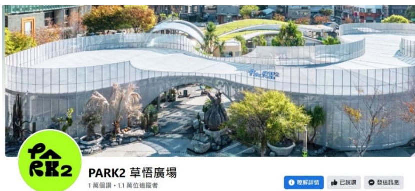
圖 6. 草悟廣場 Facebook 粉絲專頁粉絲數已破萬