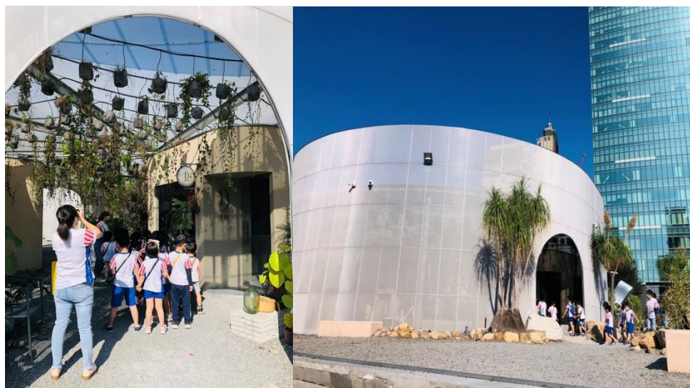
圖7. 草悟廣場鄰近幼兒園自發性前來參訪

最後，草悟廣場委外營運範圍雖然只有草悟廣場及停車場，但本局不畫地自限，持續引入民間設計與創意能量，打破場域框架，連結文化與生活，讓原看似發展受限的停車場及服務中心，華麗變身2.0、進化版的「未來公園」，以「PARK2草悟廣場」之姿晉身為臺中具指標性的國際觀光魅力據點，並具以性別友善、全齡友善等方式逐步擴大服務範圍的可能，已成為臺中市民心目中，不可或缺的存在。