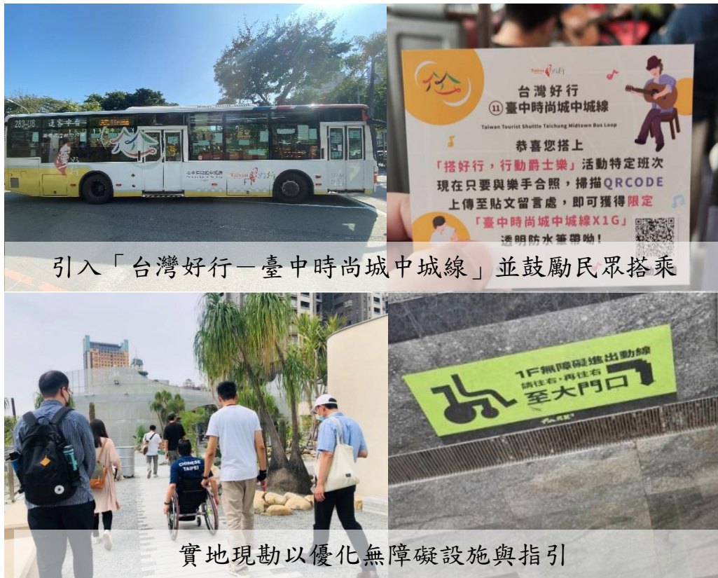
圖4. 草悟廣場優化及增設多項公共設施

(一) 本局自草悟廣場開幕以來，致力與民間機構共同營造通用化環境，以滿足各種客群的需求，包含引入「台灣好行-臺中時尚城中城線」公共運輸服務、優化無障礙設施與指引、增設電動汽車充電樁、性別友善廁所、置物櫃，以及接水盤以避免植栽澆灌系統導致場地濕滑等，將草悟廣場「全齡友善」的理念落實到各個角落，讓青年朋友、親子家庭、身心障礙者、外地遊客等不同客群都可在此找到適合自己的旅遊方式。