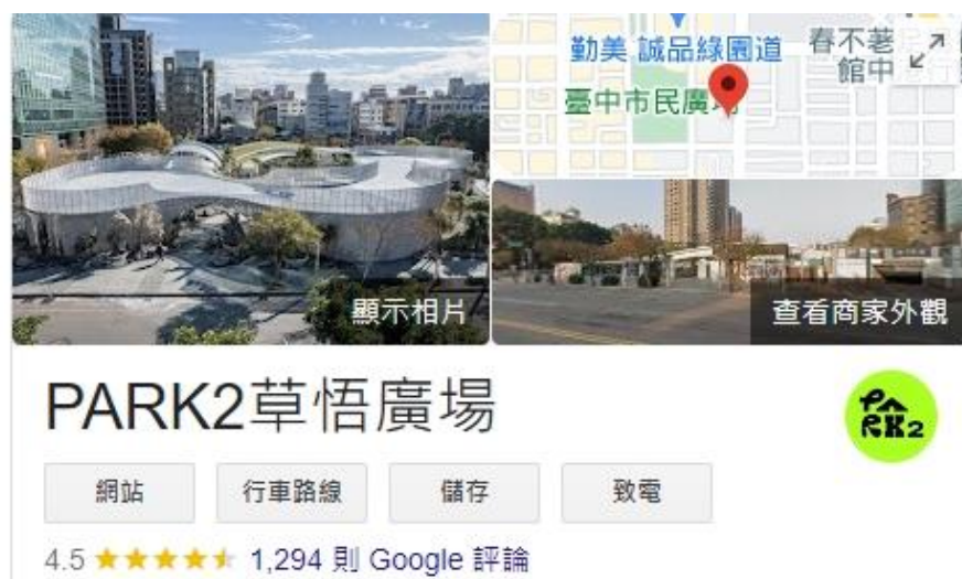
圖 5. PARK2 草悟廣場 Google 評論達 4.5 顆星