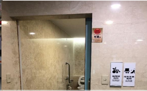
增設性別友善廁所