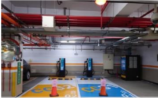
增設電動汽車充電樁