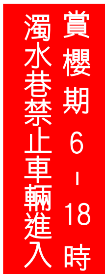
C. 禁制性質告示牌 1 面，紅底白字白邊，尺寸 180*80 公分