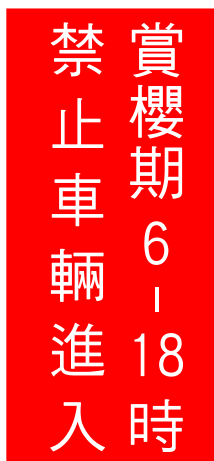
B. 禁制性質告示牌 4 面，紅底白字白邊，尺寸 180*80 公分