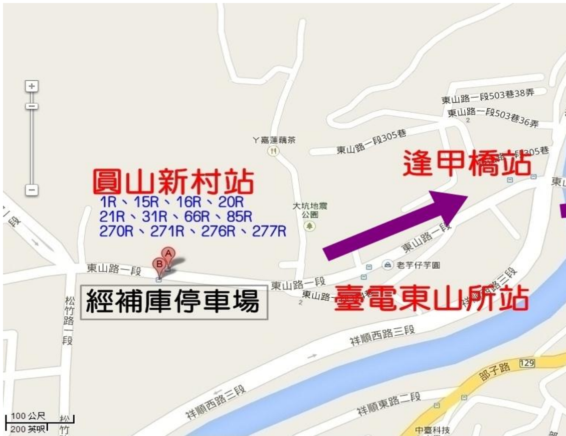
(四) 櫻花林端上下車接駁點示意圖