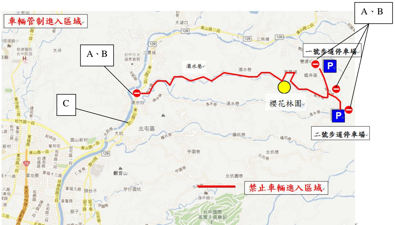
圖 1.1 交通管制範圍