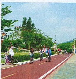
▲東豐自行車綠廊很適合親子同遊。▲新社花海每年吸引上萬遊客前來賞花。