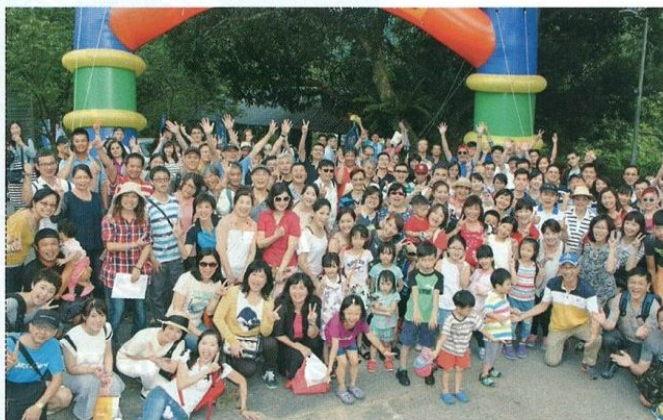
↑華信航空250位員工及眷屬合照