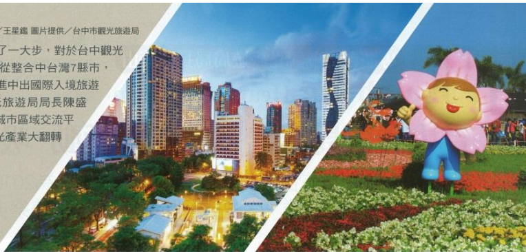
撰文/張偉浩