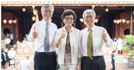
▲(左起)前任台中觀光旅遊局局長黃俊傑、台灣觀光協會會長賴廷珍、台中觀光旅遊局局長陳盛山。

以在地食材發展美食文化、華信花卉彩繪機 為2018台中世界花卉博覽會暖身 力推自行車觀光產業 盛邀日本踩街隊交流傳統祭典 推廣中台灣 博覽會暖身 多樣人文風景