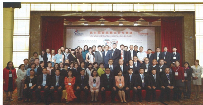
▲台越觀光合作會議共有台方80人及越方30人與會，雙方針對兩地觀光市場積極交流。

透過此次會議的舉辦，期許在已經建立堅實穩固的合作基礎上，雙方共同研討如何加強觀光產業交流合作，擴大市場推廣與觀光業界資訊互通，合作相互拉抬邊境旅遊市場成長，共創雙邊旅遊業之榮景。