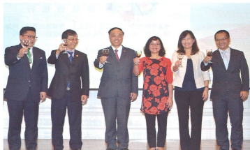
▲(左起)觀光局副局長劉喜臨、越南駐台經濟文化辦事處代表陳維海、觀光局局長周永暉、越南旅遊總局副局長阮氏清香、高雄觀光局長曾安受、越南旅遊總局執行司副局長阮建勇。