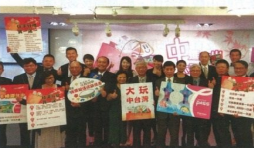
▲9月份台中市觀光旅遊局邀請台中40位觀光業者打出文創新旅買一送一、糕餅伴手禮買一送一、觀光巴士買一送一優惠大放送，成功帶起一波訪台中熱潮。

同時，觀旅局也將積極與國際郵輪航商如公主郵輪攜手共推Ply Cruises的模式，讓更多國際旅客能夠透過郵輪方式抵達台灣、深入台中。