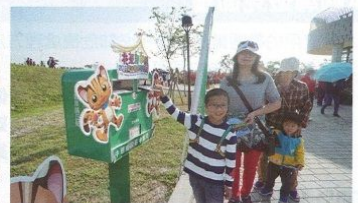
▲活動期間市府觀光旅遊局也在現場募集2,018名賞花遊客，在花毯節最後1天寄出紀念明信片，邀請全球旅客與親友相約2018台中世界花卉博覽會。