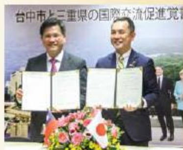
▲台中市長林佳龍與日本三重縣知事鈴木英敏簽訂促進國際交流備忘錄。

開拓新航線、締結姊妹市、簽訂觀光合作協定及備忘錄、以「主題性」推廣中台灣 台日溫泉、自行車緊密合作 與國