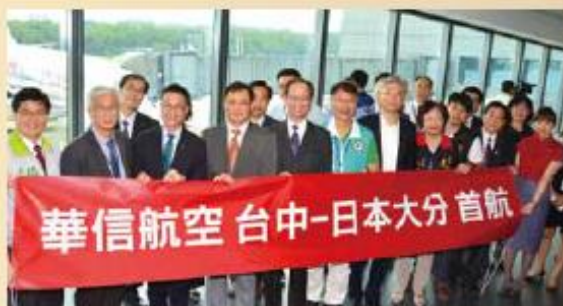
▲台中市政府與華信航空於3/15共同開辦台中-日本大分定期航線。