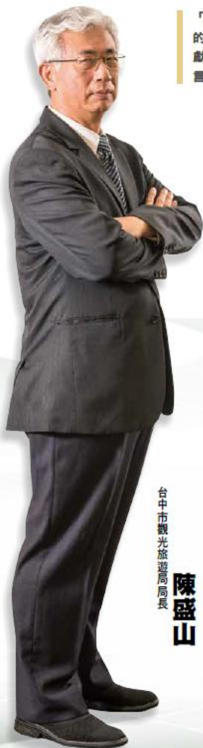
台中市觀光旅遊局局長