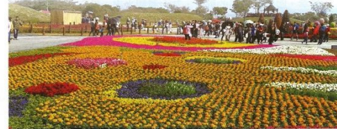
▲2016年台中國際花毯節於后里花田綠廊舉辦，成為台中再生觀光的最佳案例。

值得一提的是，台中市長林佳龍也在花毯節開幕當天宣布，未來2018花博順利閉幕後，各項相關建設包括場館、硬體設備、志工、道路建設都將予以保留，讓城市因花博而美麗，在在顯示出台中在環保議題上的用心與規劃。