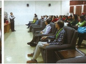
▲香港考察團聆聽簡報藉此了解台中對於觀光環保等項目。