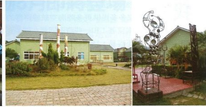
▲「寶之林廢棄家具再生中心」。