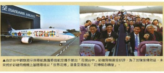
▲由於台中觀旅局與華航集團華信航空攜手推出「花現台中」彩繪飛機深受好評，為了加強宣傳效益，未來將於彩繪飛機機上繪環境以「世界花博」意象呈現推出「花博概念機艙」。

屆時機艙內部將以世界花博意象彩繪壁貼點綴機艙，營造花博氛圍，同時開發機上用品如台中特色糕餅製成的花博餅、花茶、專屬枕頭、空服員圍