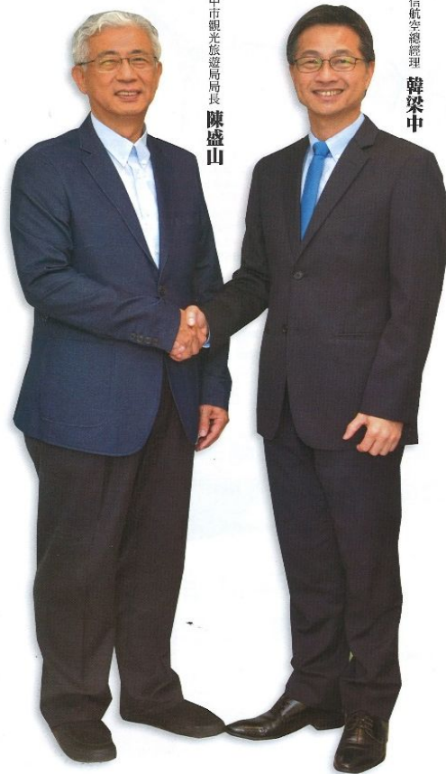
台中市觀光旅遊局局長 陳盛山