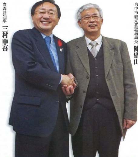
青森縣知事 三村申吾