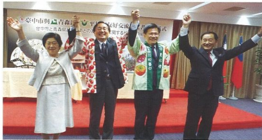
▲(左起)平川市議會議長齋藤政子、青森縣知事三村申吾、台中市市長林佳龍、平川市市長長尾忠行。

根據交通部觀光局統計，去年日本旅客來台人數達到1,895,702人次，而台灣民眾前往日本人數達到4,295,240人次，雙方交流正式突破6百萬大關，但其中觀光逆差超過200萬人次之多，如何在人數持續成長的趨勢下拉近雙方交流比例便成為重要課題。