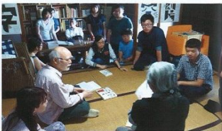
▲日本知名平面設計師平野甲賀手繪文創個展於范特喜綠光計劃。