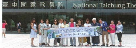
▲台中觀旅局於7/2接待日本國際女將會，特別安排參訪台中國家歌劇院。