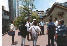
▲台中市觀光旅遊局接待江蘇組團社，特別參訪范特喜綠光計劃。