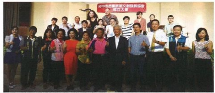
▲后里旅遊文創發展協會於7/13舉辦成軍大會，邀請后里當地知名業者共襄盛舉，推展地方文創觀光產業。