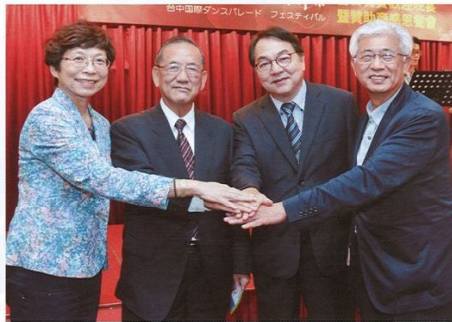
▲(左起)台灣旅遊交流協會理事長賴碧珍、台中市副市長林陵三、交通部觀光局長陳盛山、台中市長林佳龍。

第2屆踩舞祭於11/17晚間在台灣大道市政廣場展開，18隊來自台日表團以舞會友，展現出磅礴的氣勢撼動人心，攜手激盪出精彩的火花，透過電視台的即時轉播、無數民眾的現身參與，成功讓這個慶典被世人所注目。