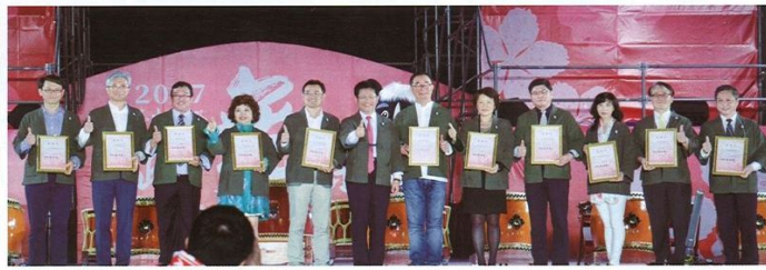
▲台中市長林佳龍(左6)感謝各大贊助公司的協助。