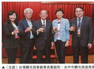
▲(左起)台灣觀光協會副會長賴碧珍、台中市觀光旅遊局長陳盛山、台中市副市長林陵三、台灣旅遊交流協會理事長賴碧珍、交通部觀光局長賴碧珍。