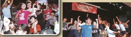
▲來自香港的百位旅客特別出席踩舞祭，顯示出台中的魅力已散播到國際。

台中國際踩舞祭感恩餐會中，來自日本與台灣的表團輪番上台演出，將舞蹈家熱情與活力斷無遺。