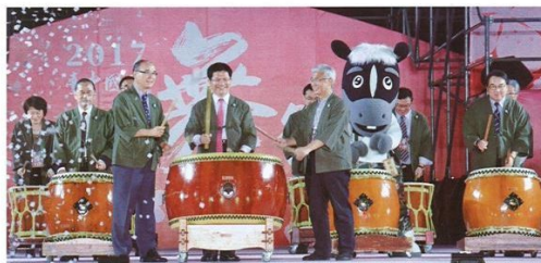
▲(中間左起)交通部觀光局長賴碧珍、台中市長林佳龍、台中市觀光旅遊局長陳盛山