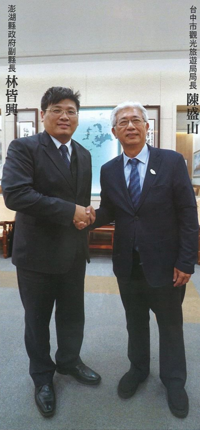
台中市觀光旅遊局局長 陳盛山