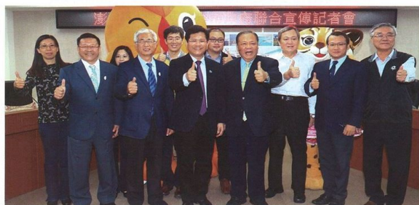
▲台中市長林佳龍（前排左3）與台中市觀光旅遊局局長陳盛山（前排左2）前進澎湖拜訪澎湖縣長陳光復（前排左4）及其團隊，共同行銷澎湖2018世界最美麗海灣嘉年華與2018台中世界花卉博覽會。