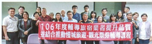
▲台中觀光旅遊局特別召集民宿業者規劃課程，推廣慢城旅遊理念，以及提供烹飪課程輔導業者以在地食材入菜。

合浪漫台3線的慢活議題及國際慢城理念，僅需集結山城業者規劃特色主題遊程，連結國際慢城認證8大公約、72大指標，便可發展慢活、慢食、慢遊的旅遊型態。而首要工作，便是打造慢食。