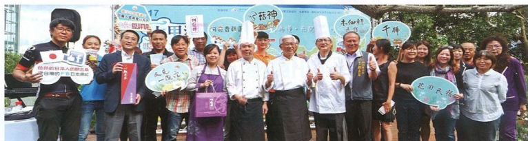
▲大甲溪觀光文化祭成功讓台中轉換旅遊型態，為抓住樂齡客群打下基礎。

隨著慢活、樂活的深度旅遊體驗已成為未來旅遊趨勢，龐大的銀髮客群出遊更是眾多縣市政府亟欲吸引的大餅。台中市觀光旅遊局局長陳盛山看準其中無窮潛力，特別以3慢（慢食、慢活、慢遊），為台中找尋出適合吸引樂齡客群的脈絡，打造出樂遊慢城。