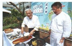
▲台中觀光旅遊局局長陳盛山親自下廚，用在地食材點亮台中慢城運動。

曾經在上任初期跑遍台中各區角落的陳盛山便有感而發，台中山城區內因休閒農業、民宿、自行車道觀光資源豐富，且正位於浪漫台3線旅遊廊帶的南口，故扣