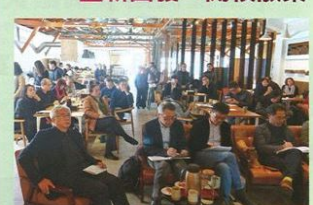
▲大小老闆圍坐沙龍，經驗傳承。

午茶的產業鏈，將茶葉、咖啡、糕餅等依循著從產地到餐桌的模式，創造出全新的產業價值鏈，讓台中午茶生活節的品牌得以擴散，搭配近幾年積極參加的台灣美食展，將得時台中、花漾台中等概念融入，從「承」到「轉」。