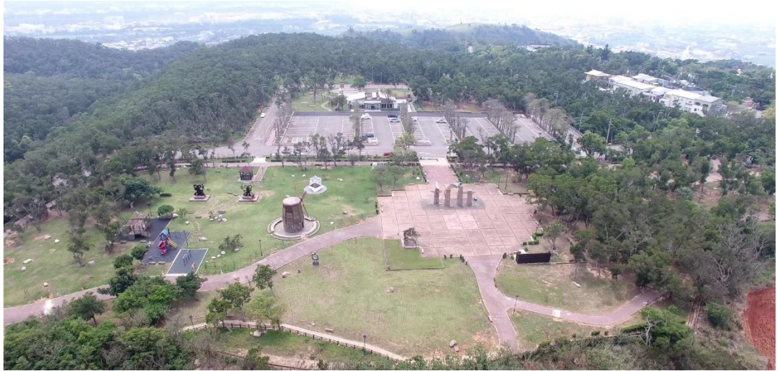
圖 3.2-2 基地現況空拍圖-1