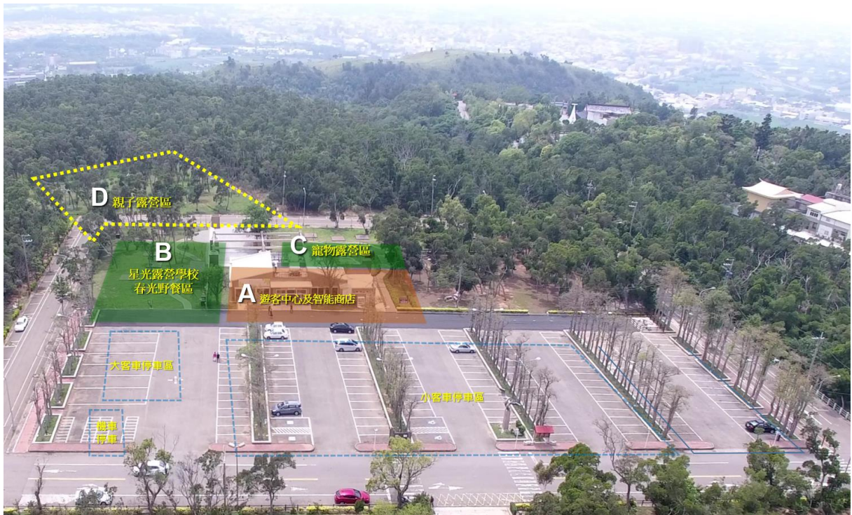
圖 3.2-3 整體現況空拍圖-2