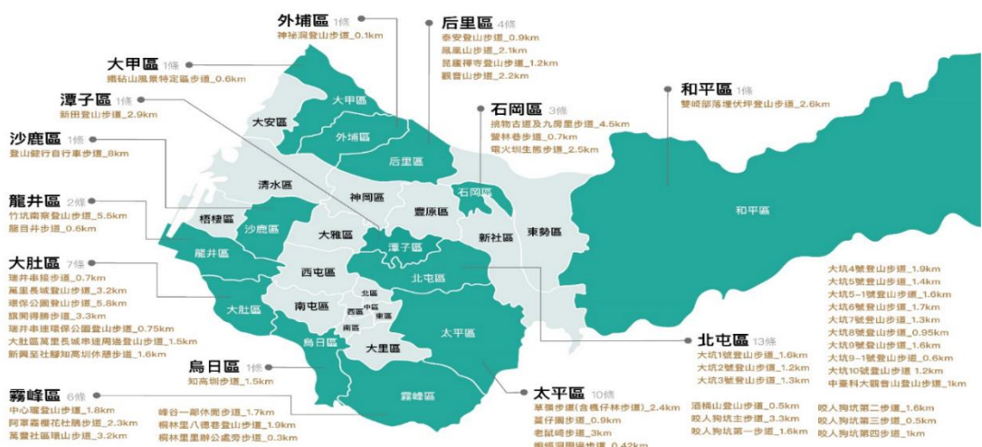
圖 4.臺中市政府觀光旅遊局權管登山步道總表