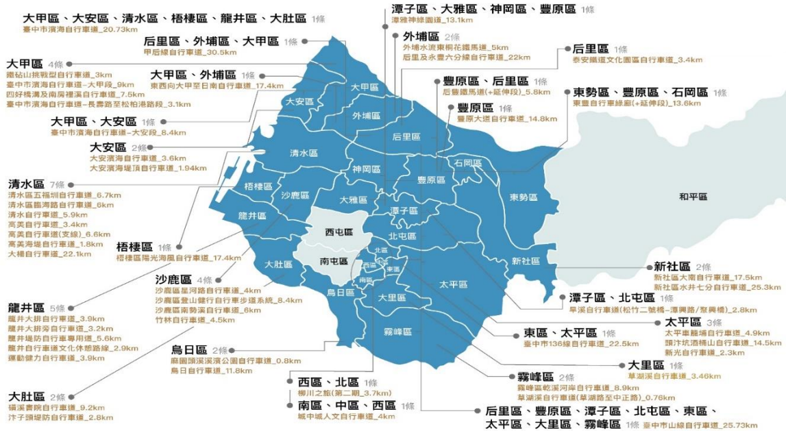
圖 3.臺中市政府觀光旅遊局權管自行車道總表