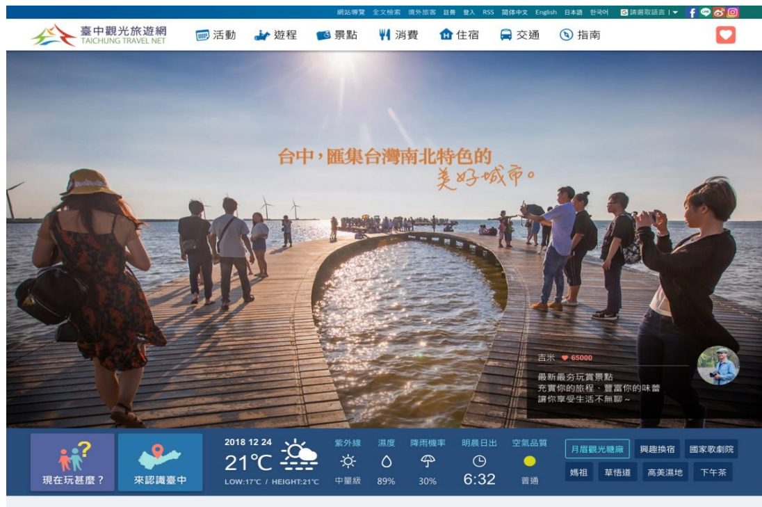
圖 6. 臺中觀光旅遊網優化改版示意

臺中觀光旅遊網配合網路瀏覽者習慣及喜好持續更新、優化，以當季主題露出旅遊推薦，導入社交軟體 FB 及 IG 文章資訊露出，另外首頁導入即時天氣、空氣品質、紫外線、災害預警提醒等資訊，提供 LBS 適地化服務，給予遊客位置最即時週邊旅遊訊息，讓遊客能接收第一手資訊。110 年度網站預計瀏覽成長量突破 1,000 萬人次。