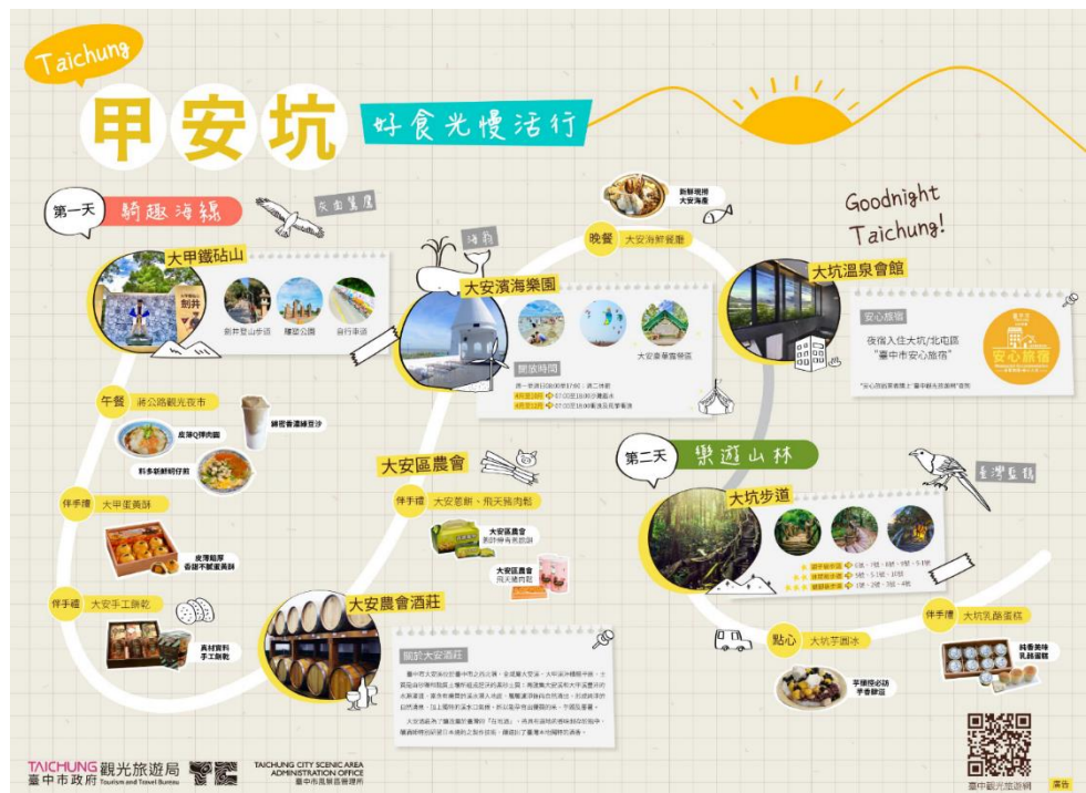
圖 2. 甲安坑主題魅力遊程