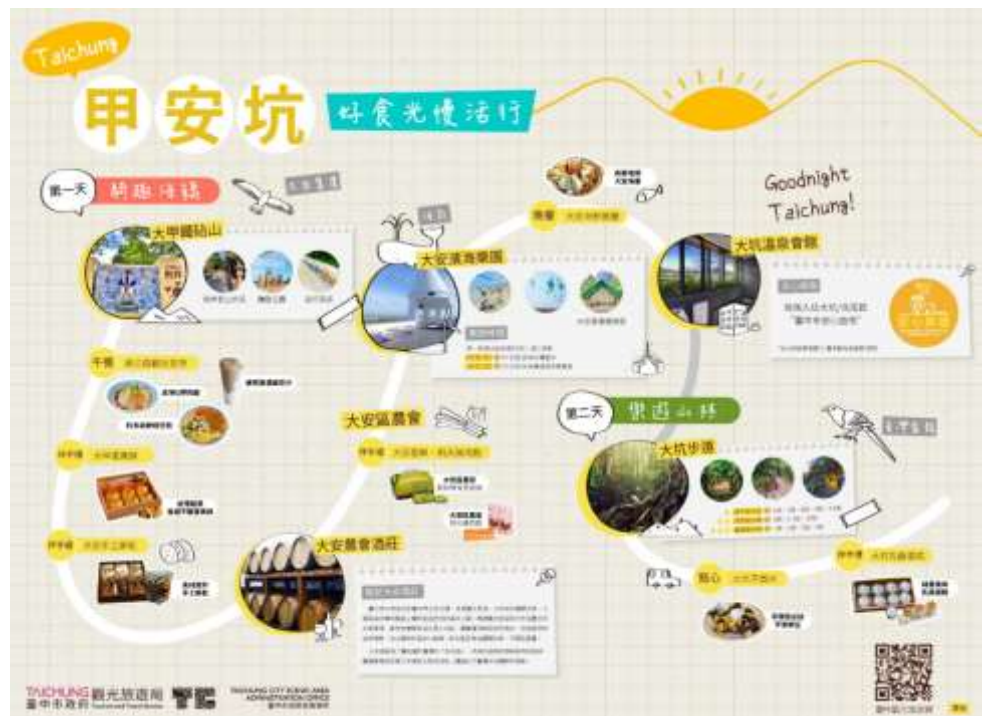
圖 2.甲安坑主題魅力遊程