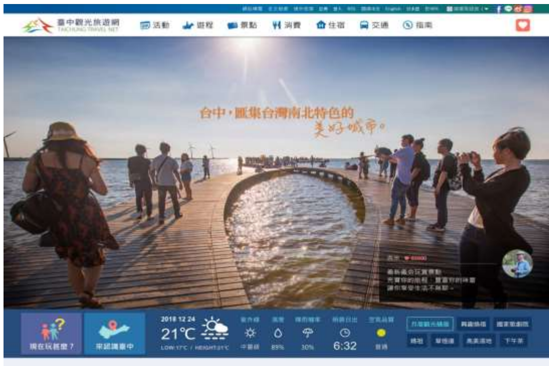
圖 6.臺中觀光旅遊網優化改版示意

臺中觀光旅遊網配合網路瀏覽者習慣及喜好持續更新、優化，以當季主題露出旅遊推薦，導入社交軟體 FB 及 IG 文章資訊露出，另外首頁導入即時天氣、空氣品質、紫外線、災害預警提醒等資訊，提供 LBS 適地化服務，給予遊客位置最即時週邊旅遊訊息，讓遊客能接收第一手資訊。110 年度網站預計瀏覽成長量突破 1,000 萬人次。