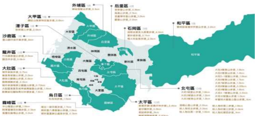
圖 4.臺中市政府觀光旅遊局權管登山步道總表

TAICHUNG 觀光旅遊局 臺中市政府 Tourism and Travel Bureau