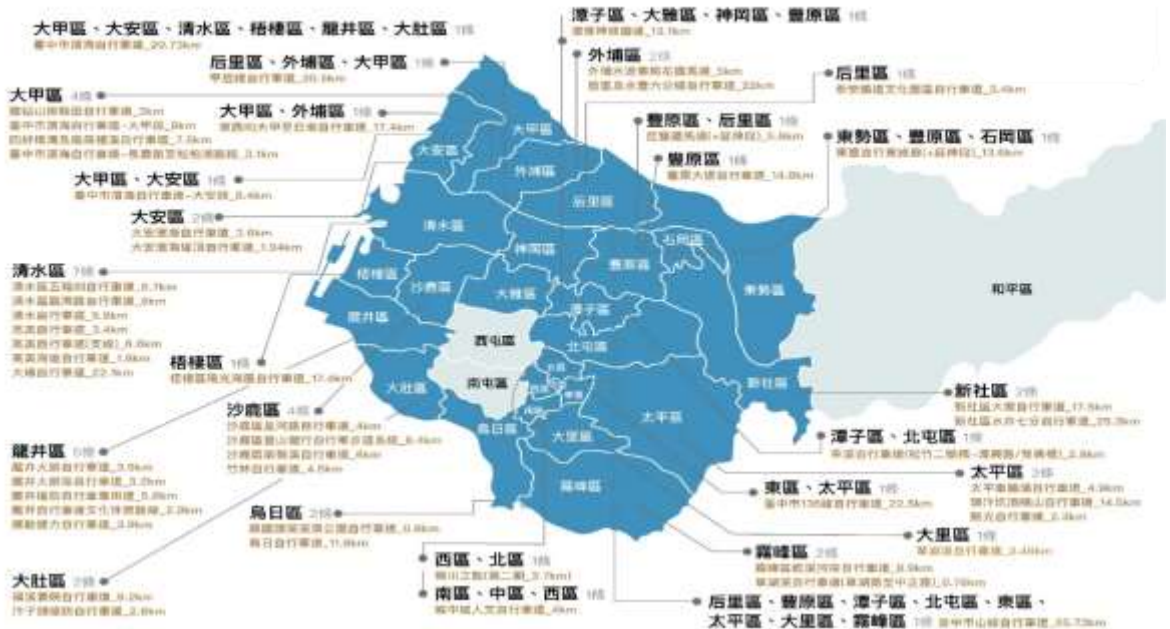
圖 3.臺中市政府觀光旅遊局權管自行車道總表

TAICHUNG 觀光旅遊局 臺中市政府 Tourism and Travel Bureau