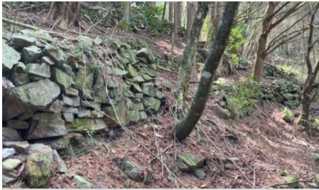
1. 紅檜林砌塊石坡面

本計畫路徑可眺望環山部落及周圍高山與溪谷景緻，後續沿稜線返回環山部落形成一環狀步道系統，本計畫範圍總路徑長度約為1.5公里。