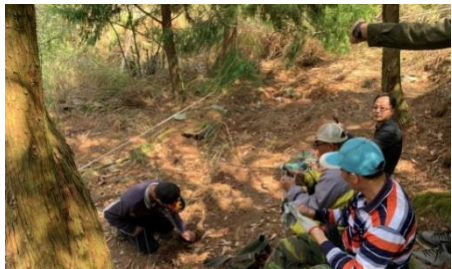
2. 部落獵人解說導覽點