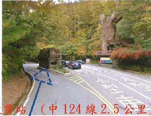
武陵收費站 (中 124 線 2.5 公里)